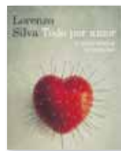
Todo por amor Y otros relatos criminales Lorenzo Silva Editorial Destino Novela negra

menos, Yo no sabía lo que hacía mi marido, Corrupción inmobiliaria o La maté porque era mía. "Los lectores encontrarán muchas referencias a la Guardia Civil y a Bárcenas", co-